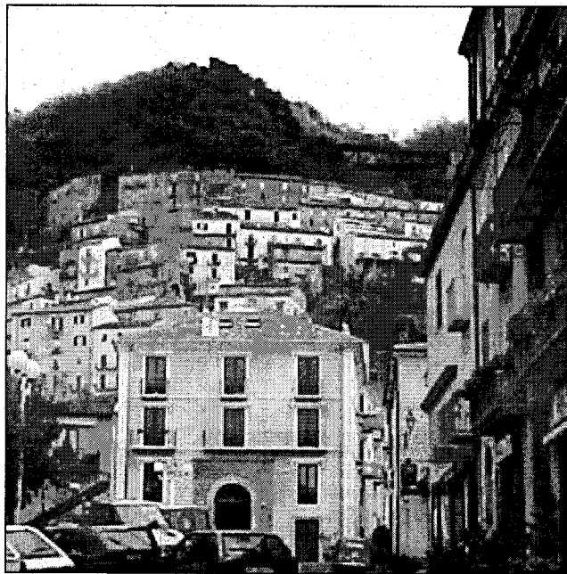
Una veduta di Lauria e, a destra, l'ospedale lauriota

Un'ipotesi in contrasto non soltanto con il buon senso, urbanistico ed economico, ma anche con gli impegni già assunti dalla Regione Basilicata che, su iniziativa del capogruppo so-